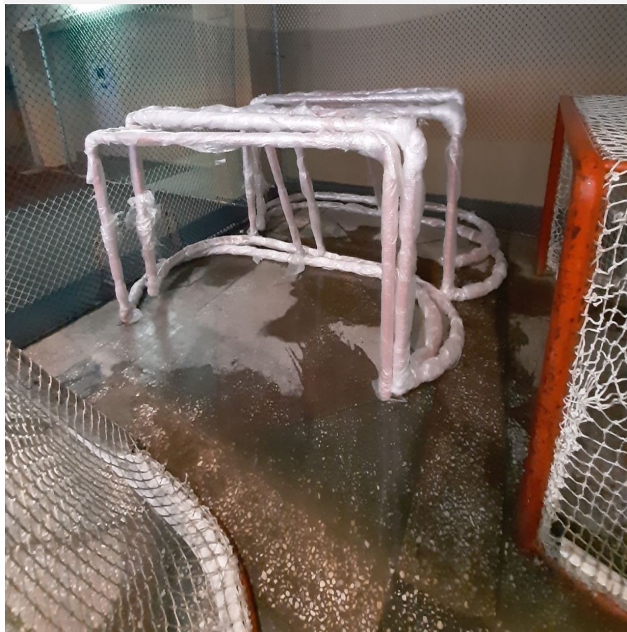
ворота хоккейные с сеткой